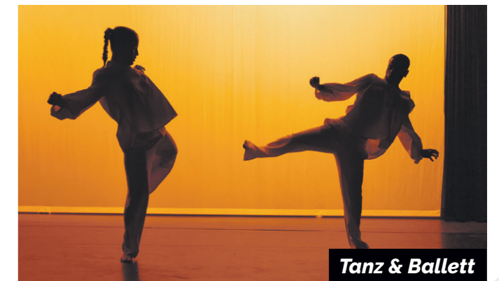
Tanz & Ballett

erfolgreichsten Rockalben aller Zeiten zählt - ihn live zu erleben ist ein unvergessliches Erlebnis. Auch mit über 70 rockt er die Stadien auf der ganzen Welt. Der Boss ist die große Inspiration der Band Brucified aus Brabant/NL. Mit ganz viel Enthusiasmus spielen sie seine schönsten Balladen bis zum Rock, bringen das alte Repertoire und sind auch ebenso innovativ. Ganz nah am Original bieten sie das gleiche Erlebnis, übertragen Leidenschaft und Energie auf das Publikum, so wie die Live-Konzerte ihres Vorbilds. Fans vom Boss werden garantiert einen wunderbaren Abend erleben.