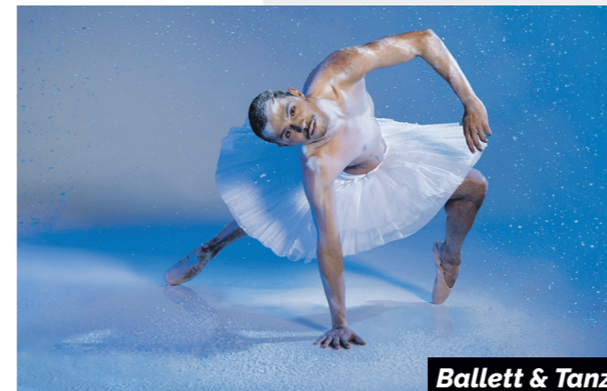
Ballett & Tanz

aus dem musikalischen. Vermächtnis überraschen Freuen Sie sich auf 'A collection of great Floyd songs' mit quadrofonischem Sound, einer spektakulären Lichtshow und eindrucksvollen Bildern, so als ob die legendarische Band niemals aufgehört hätte zu bestehen. Schließen Sie für einen Moment Ihre Augen und oben auf dem Podium steht die Musiklegende.