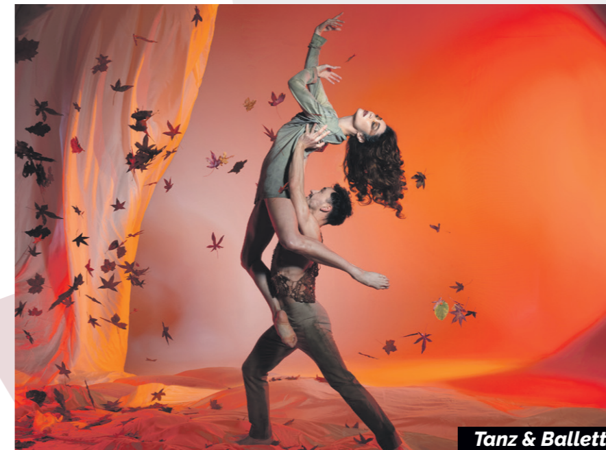
Tanz & Ballett

NEU! „TISCHLEIN DECK DICH“ VOR DIESER VORSTELLUNG GENIEßEN SIE WUNDERBARES ESSEN IM DE STORM.